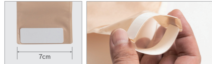
3-1 排出しやすい幅7cmの排出口。(ロールアップ)

1日に何回も排出作業をすることもある オストメイトのみなさんに適した シンプルな排出デザイン