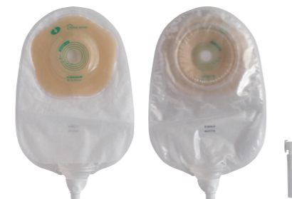
15-35mm Midi 透明