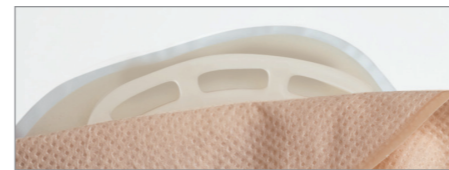
3-3 ベルトタブが 3カ所だから 袋の向き調整が可能。