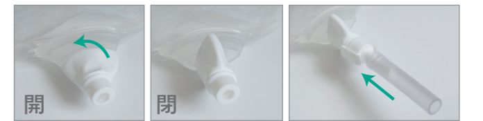
3-4 ひっかかりなく安全、シンプルな回転コック式。(ウロストミー用)