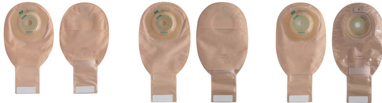
15-45mm Midi 肌色