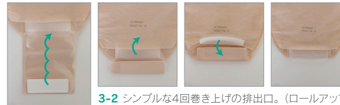
3-2 シンプルな4回巻き上げの排出口。(ロールアップ)