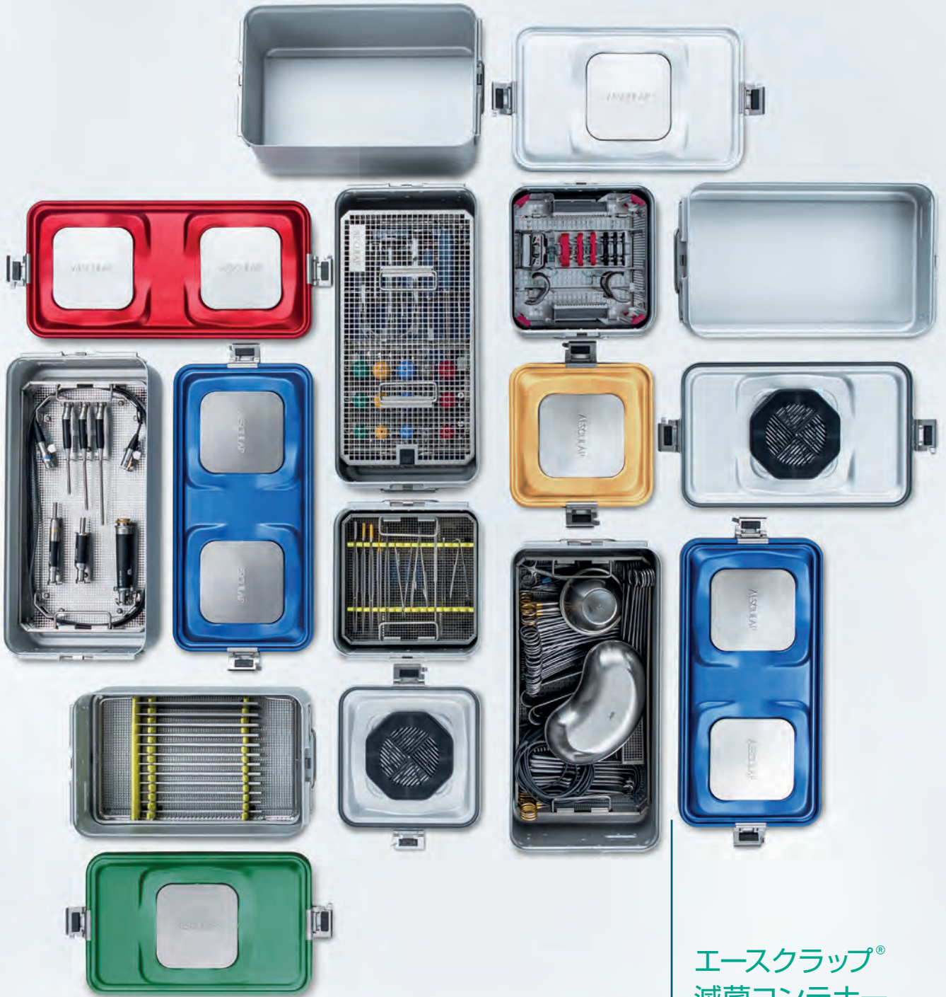
エースクラップ® 滅菌コンテナ システム