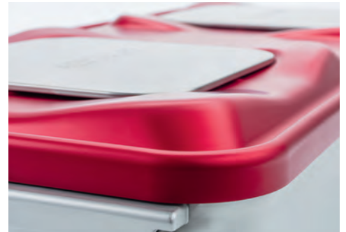
プライムライン® プロ 蓋