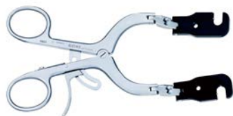
BW137R PEEKカウンターレトラクター