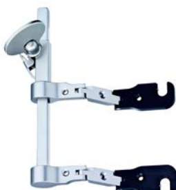
BW139R PEEK頸椎レトラクター